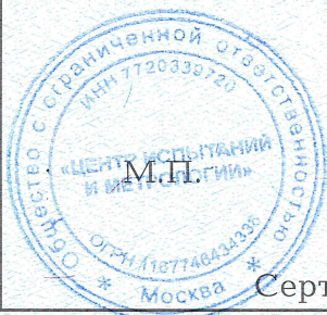
Схема сертификации: 3с.